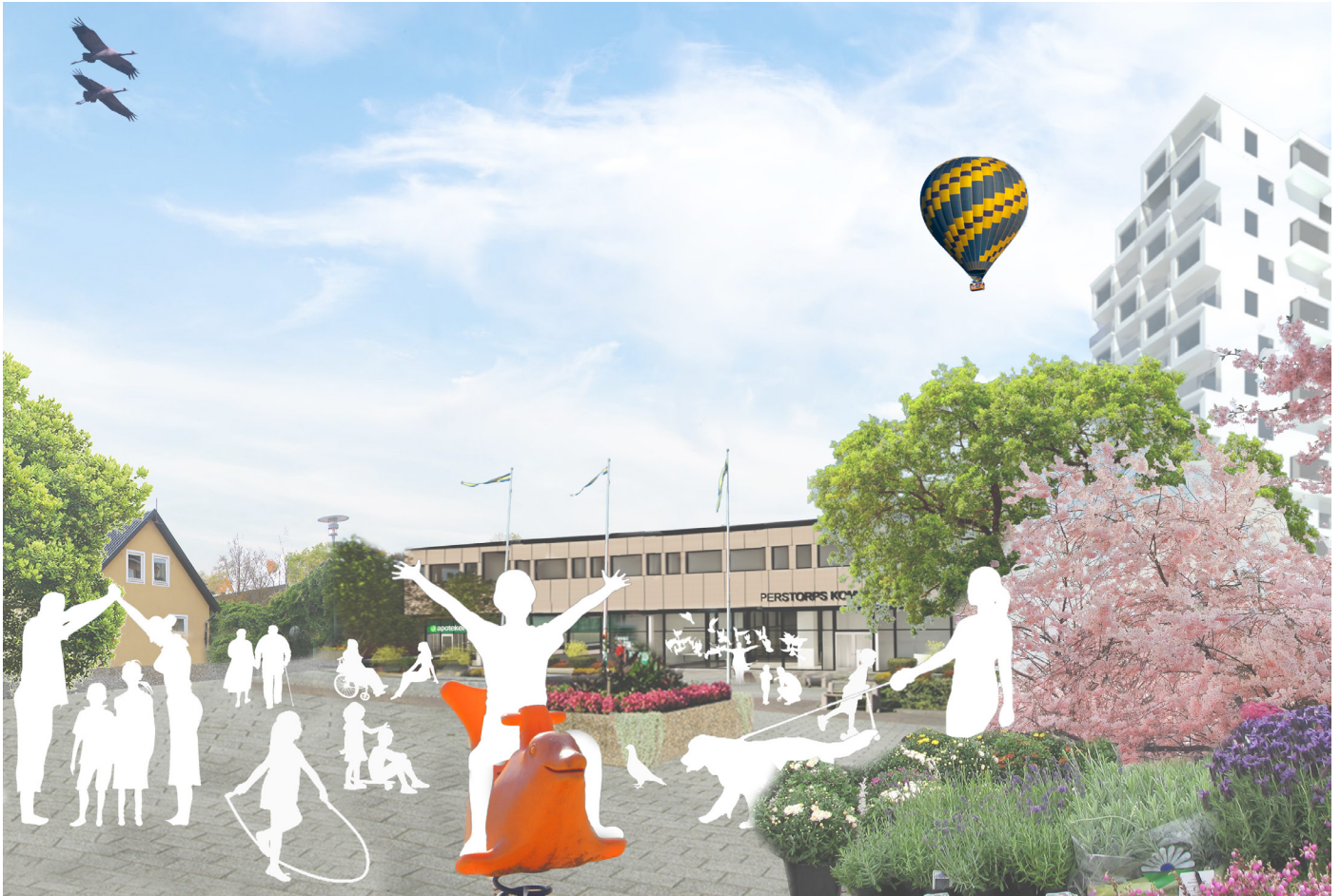
Visionsbild Perstorp - Mötesplatserna är viktiga.