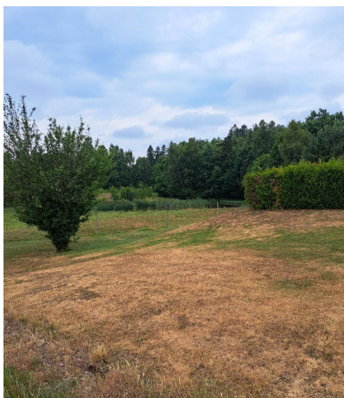
Bildtext: Fotografi över planområdets sydvästra del, gräsområde som hanterar del av dagvatten från bostäder och väg.

Planområdet består av gräsyta och bebyggt område. Dagvatten från närliggande väg och bostad delvis infiltreras till viss del i gräsytan. Dagvatten som inte kan tas upp av markytan avvattnas via dagvattensystem till recipient Perstorpsbäcken.