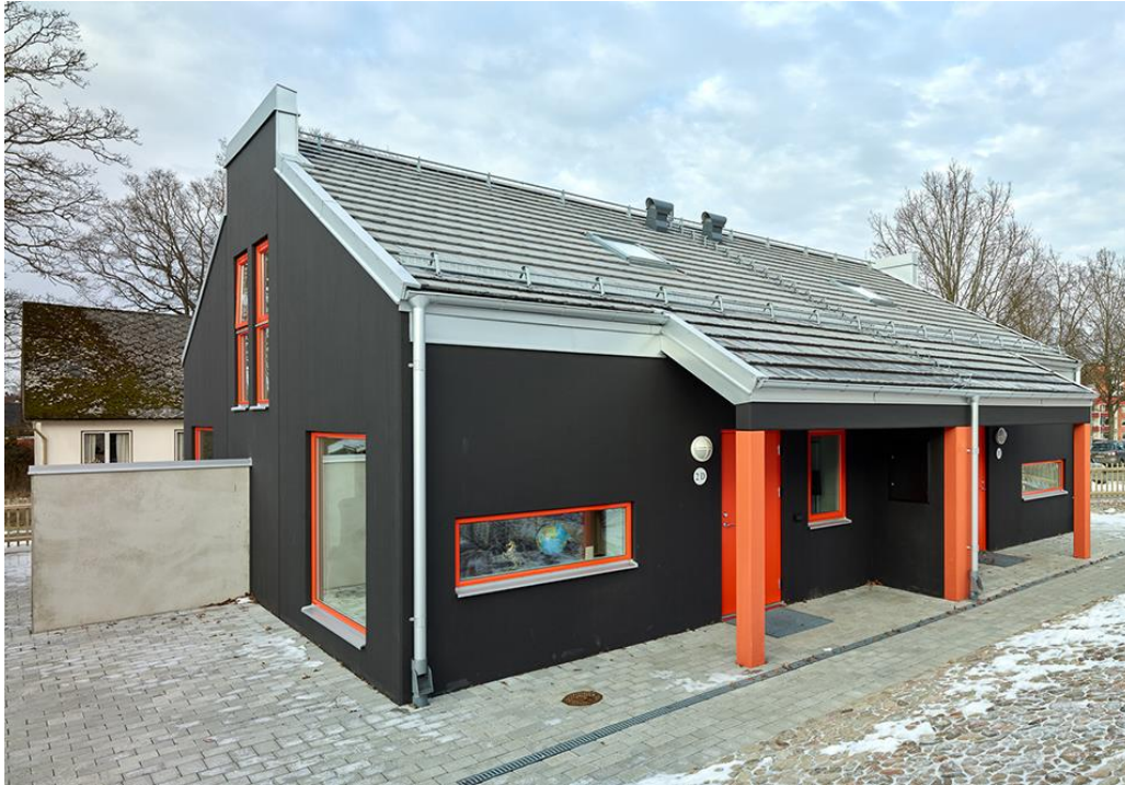
Perstorp1 – Koncepthuset med fyra kompakta lägenheter (Sweco Architects)