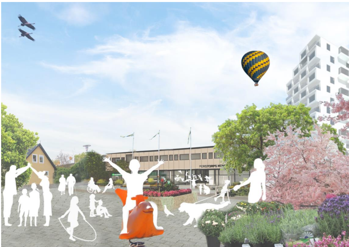
Visionsbild Perstorp 2030 – Mötesplatserna är viktiga

Perstorps kommun ska erbjuda bostäder för olika behov och för livets skilda skeden. Därför ska ny bebyggelse och förändringar bidra till ett mer varierat bostadsbestånd och fler boendeformer. Blandade delar av samhället med fler boendeanternativ ger levande miljöer samtidigt som integration främjas och den som behöver byta bostad får bättre möjlighet att stanna i sin närmiljö. Nya bostäder ska koncentreras till områden med god kollektivtrafik, cykelstråk och tillgänglig service eller där det finns möjlighet att tillskapa detta på sikt. Bygg centrum-, stations- och naturnära.