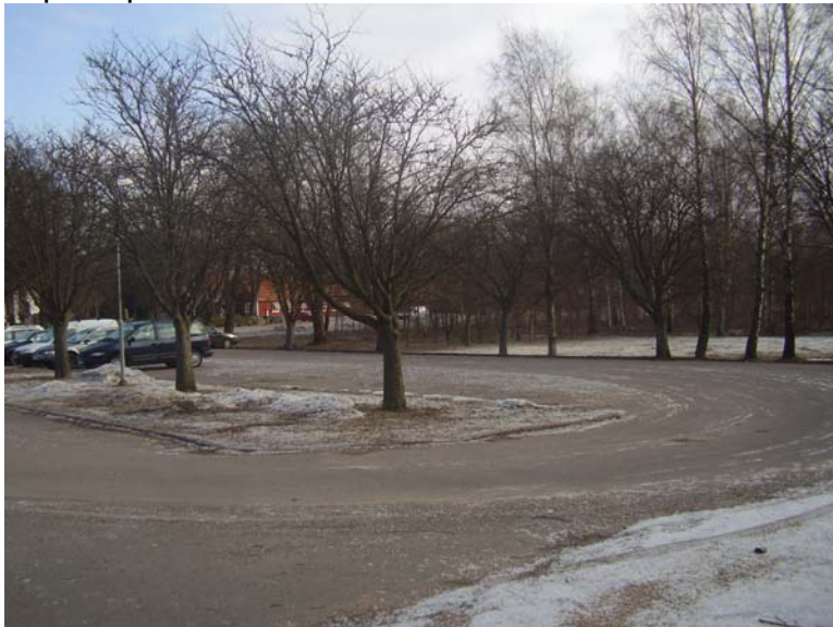
Foto 1. Planområdet

Planprocessen föreslås göras med normalt planförfarande då detaljplanen föreslås överföra allmän platsmark till kvartersmark. Förskolan är en allmän verksamhet som dels alstrar ljud och trafik dels berör allmänheten genom att barn och barnbarn kan få plats på förskolan.